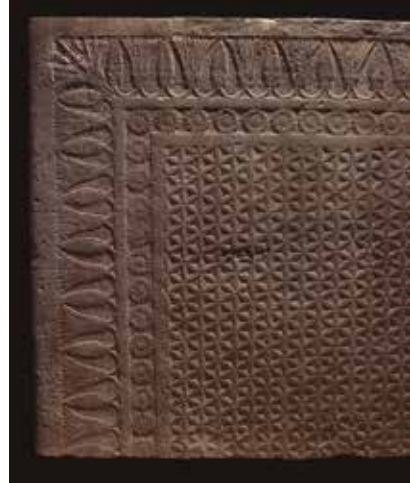
Llindar de porta tallat Palau nord, Nínive (Iraq) 645-640 aC Pedra calcària

La profecia de Marduk (text anònim) c. 713-612 aC