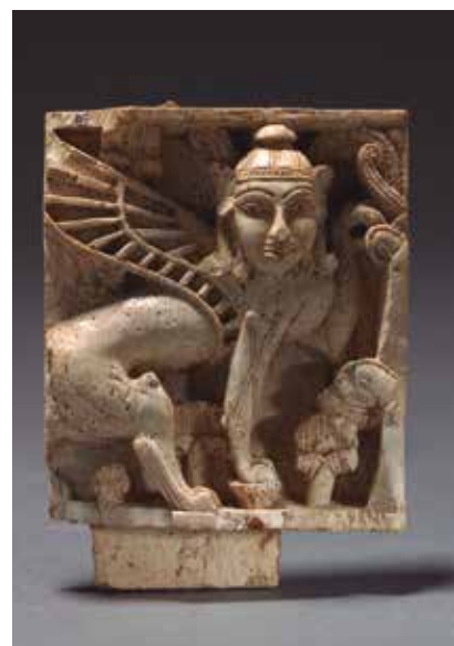
Placa decorativa Fortalesa de Salmanassar, Nimrud (Iraq) 900-700 aC Marfil