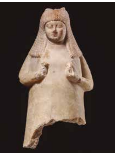
Vas en forma de dona Sippar (Iraq) 700-600 aC Calcita

Veus dels protagonistes i cronistes de l'època descriuen el que va representar el luxe en un moment de la història en què la riquesa i l'opulència podien definir el poder econòmic i polític d'aquests antics imperis.