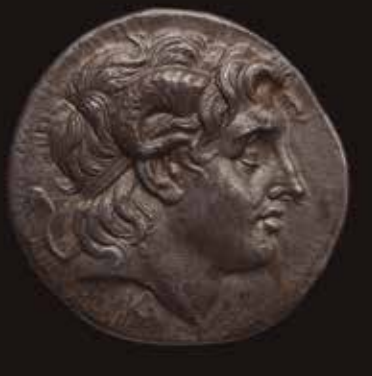
Moneda amb imatge d'Alexandre el Gran Pèrgam (Turquia) 306-281 aC Plata

L'entrada d'Alexandre a la ciutat de Damasc mostra com era el saqueig de l'època, però també el que representava el luxe, i l'admiració que els grecs sentien vers l'exquisidesa de la reialesa aquemènida i vers Darios, que havia aconseguit fugir de l'exèrcit d'Alexandre, deixant enrere totes les possessions del seu imperi.