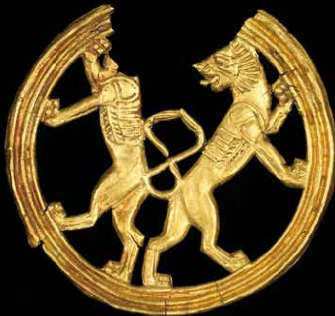
Detall d'una placa d'or, accessori per a ornament a la roba, Iran, 600-400 aC.