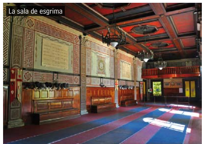
La sala de esgrima