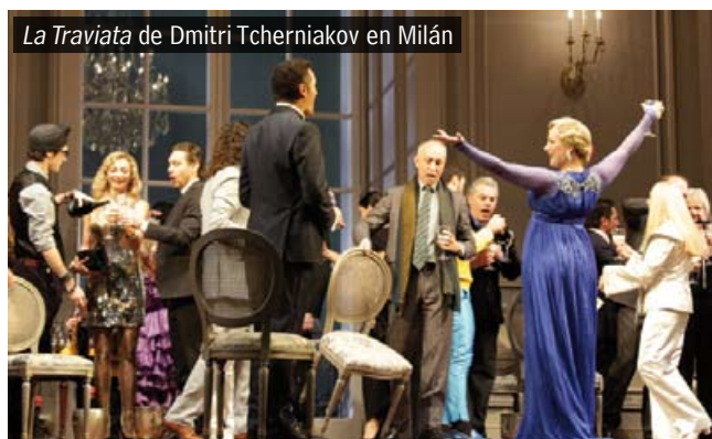
La Traviata de Dmitri Tcherniakov en Milán