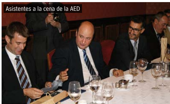
Asistentes a la cena de la AED