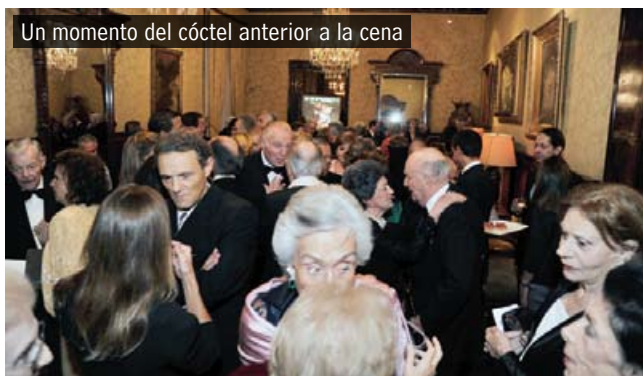
Un momento del cóctel anterior a la cena