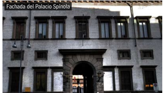
Fachada del Palacio Spínola

Società del Giardino Via San Paolo, 10, 20121 Milano Tel. +39 02 780981 / 76020850 circolo@societadelgiardino.it www.societadelgiardino.com