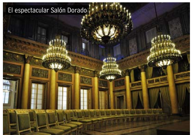
El espectacular Salón Dorado