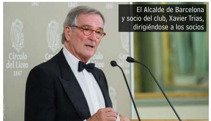
El Alcalde de Barcelona y socio del club, Xavier Trias, dirigiéndose a los socios