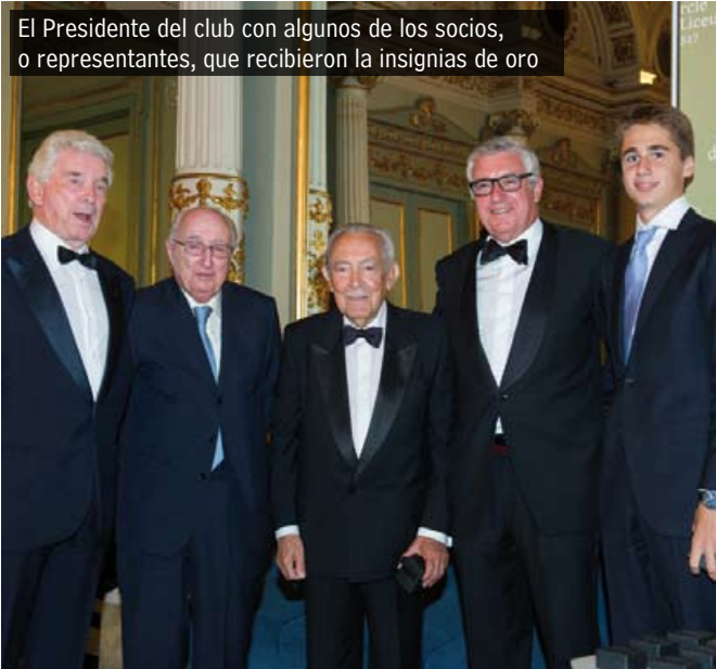
El Presidente del club con algunos de los socios, o representantes, que recibieron la insignias de oro