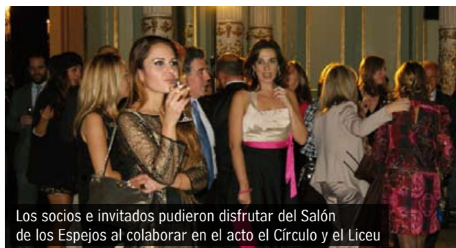
Los socios e invitados pudieron disfrutar del Salón de los Espejos al colaborar en el acto el Círculo y el Liceu