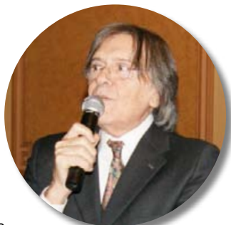
Josep Maria Flotats

Poseedor de la Legión de Honor y la Orden de las Artes y las Letras francesas, Flotats relató que la vocación le llegó de párvulo, y recordó el día que interpretó ante sus compañeros y “una maestra tonta” un poema de Alfred de Vigny con tanta pasión que esta le puso un cero para que en el futuro dejara de hacer el payaso, mientras toda la clase se reía de él. “Es probable que desde entonces comenzara a soñar mi venganza”, dijo. Más tarde llegarían sus 25 años en París, convertirse en sociétaire de la Comédie Française en 1982 y la Medalla de Oro al Mérito en las Bellas Artes, entre