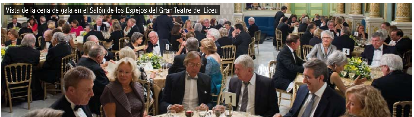
Vista de la cena de gala en el Salón de los Espejos del Gran Teatre del Liceu

Muchos fueron los familiares, amigos y consocios que les acompañaron en esta cena de gala que se celebró en el club y en el Salón de los Espejos del Gran Teatre del Liceu.