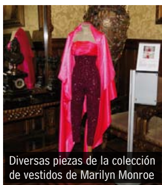
Diversas piezas de la colección de vestidos de Marilyn Monroe