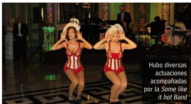
Hubo diversas actuaciones acompañadas por la Some like it hot Band