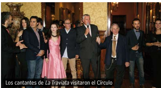
Los cantantes de La Traviata visitaron el Círculo

El 6 de noviembre se invitó a Romà Gubern , escritor y catedrático de la Universidad Autónoma de Barcelona, que presentó la reedición de su libro Historia del cine . El acto contó con la presencia del director de cine Manuel Gutiérrez Aragón .